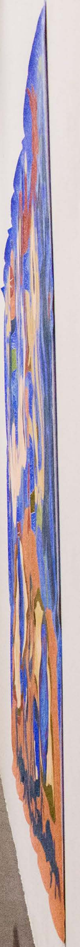
The Rotating Raffle Drum, 2019 Vista de la exposición Páramo, Guadalajara, México