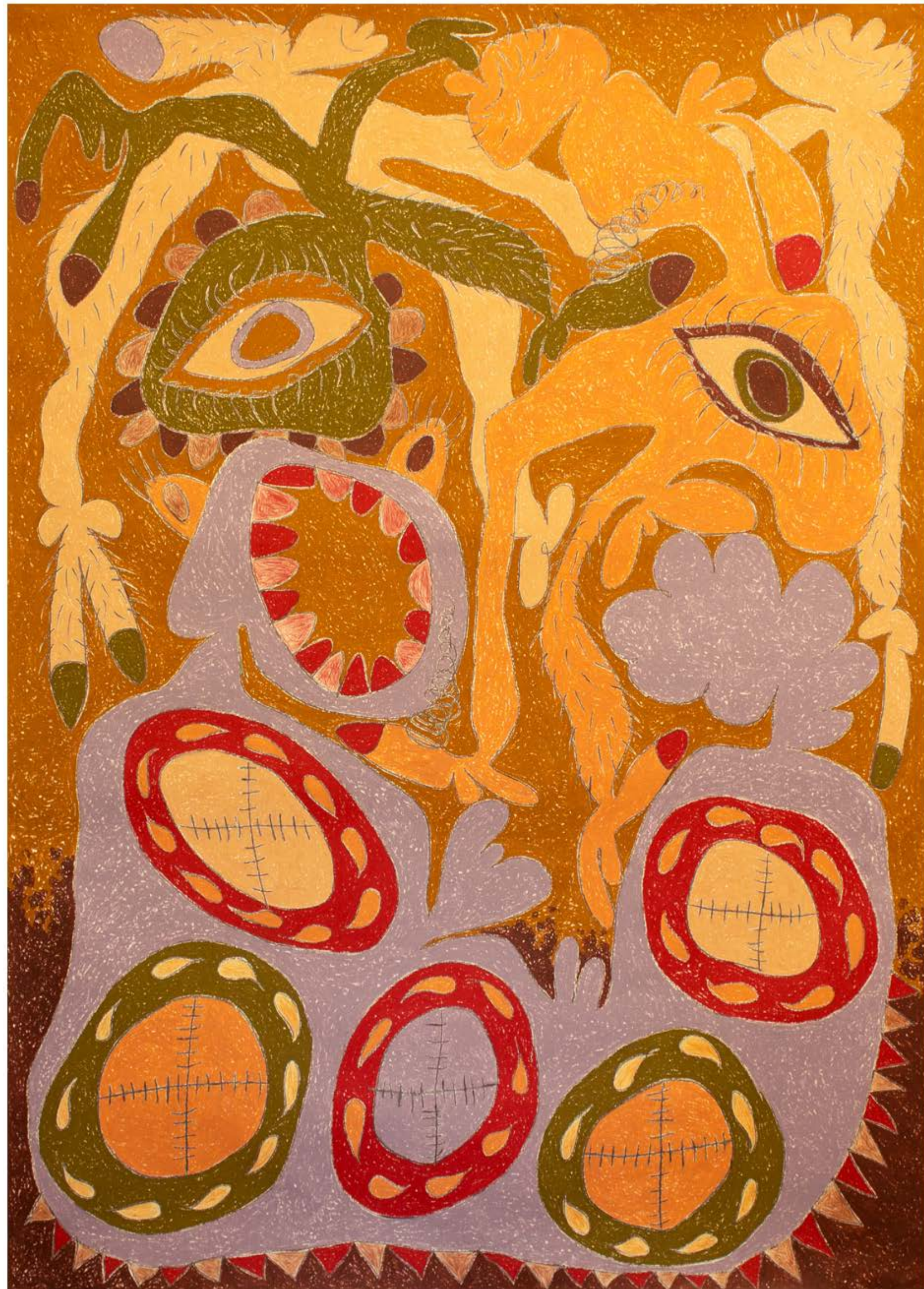
Got a paper cut, 2019

Pastel al óleo, lápiz de color y grafito sobre papel / Oil Pastel, Color Pencil and Graphite on Paper