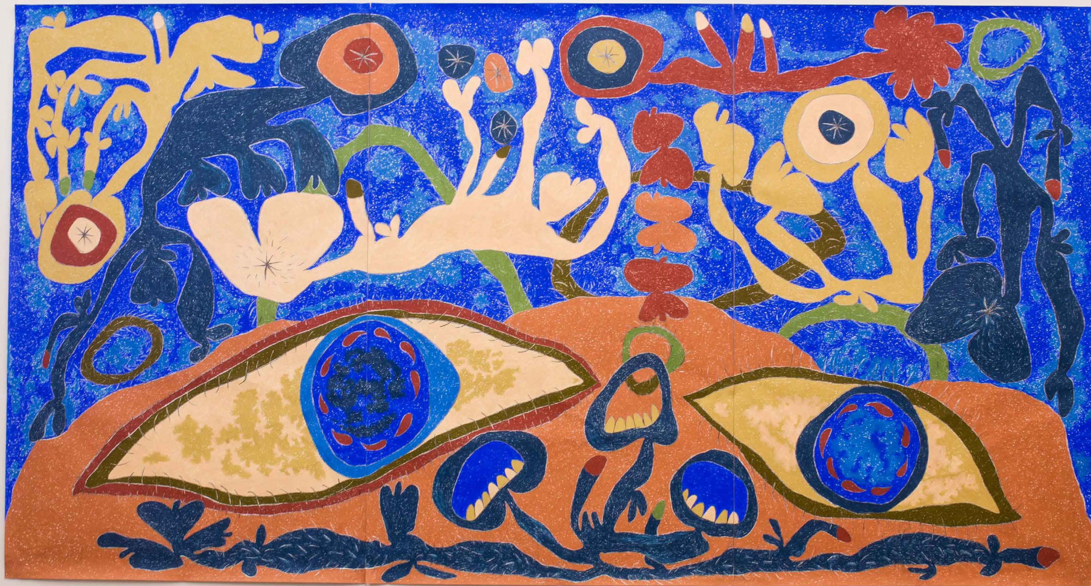
The Rotating Raffle Drum, 2019 Vista de la exposición Páramo, Guadalajara, México