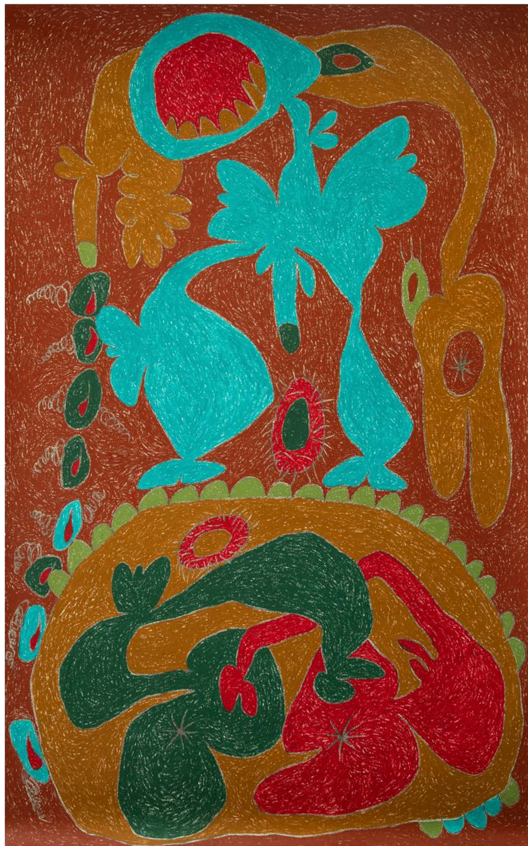
This ground is not stable, 2019

Pastel al óleo, lápiz de color y grafito sobre papel / Oil Pastel, Color Pencil and Graphite on Paper 236 x 152 cm / 96 x 60"