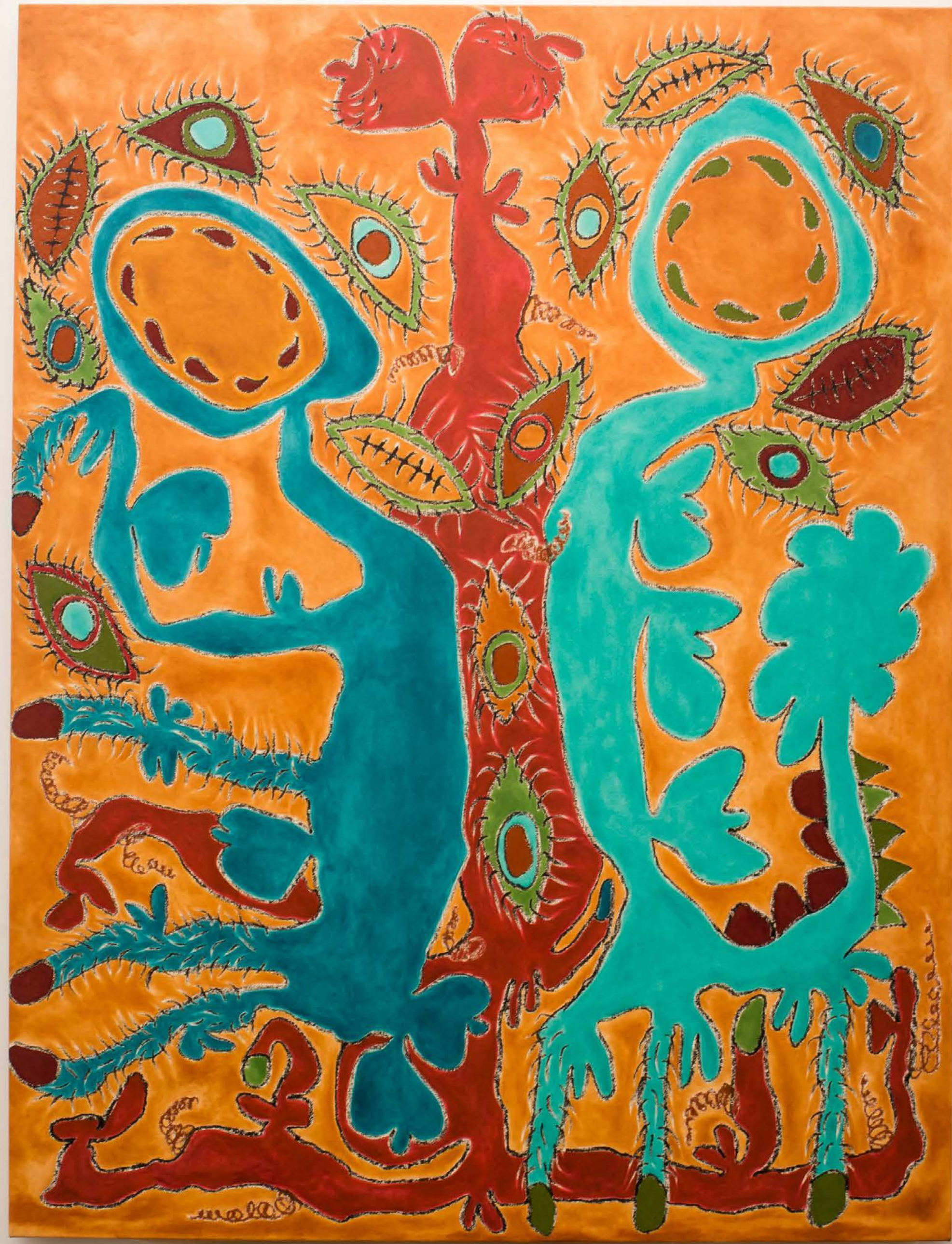
The Rotating Raffle Drum, 2019 Vista de la exposición Páramo, Guadalajara, México