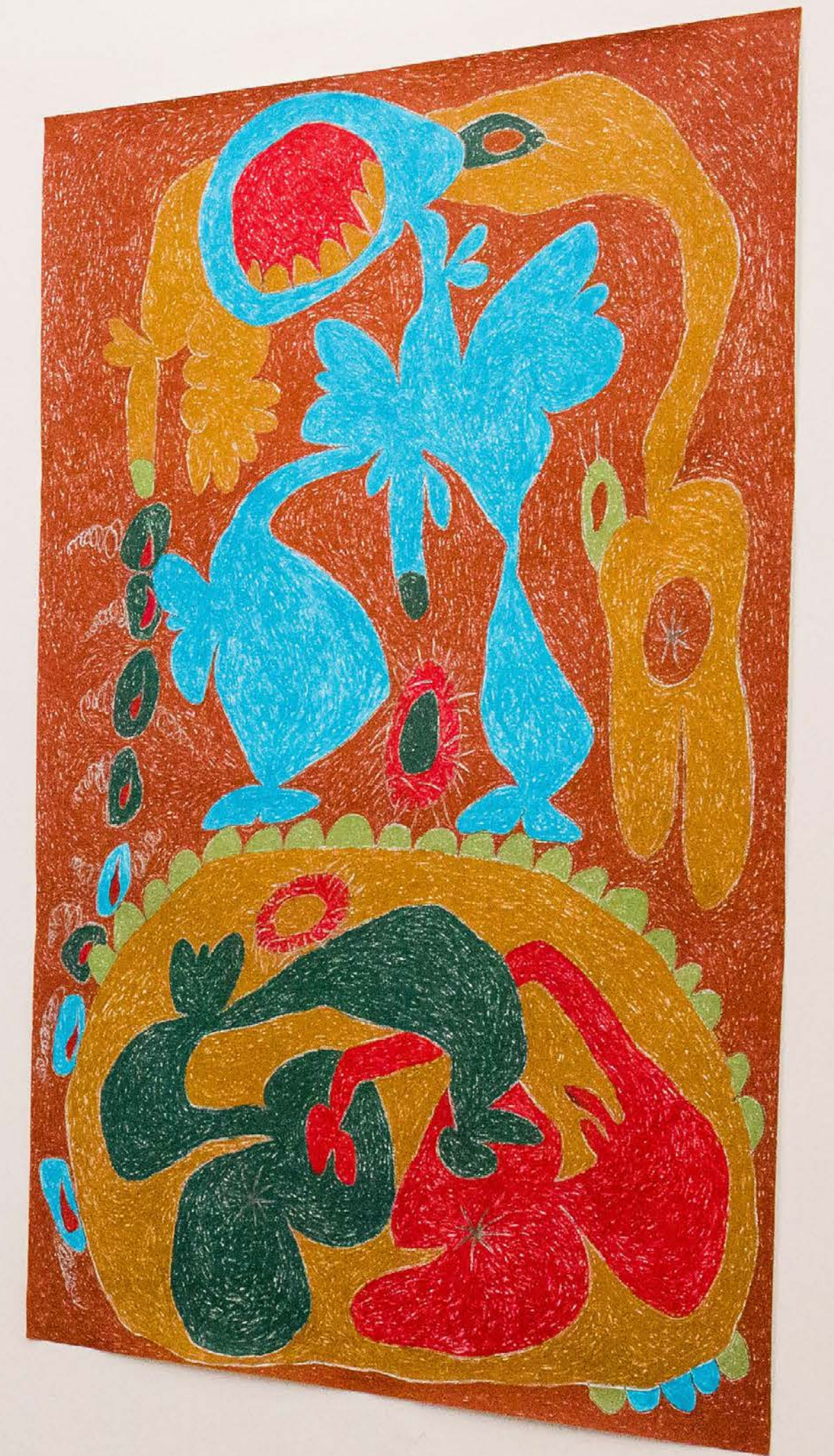
The Rotating Raffle Drum, 2019 Vista de la exposición Páramo, Guadalajara, México