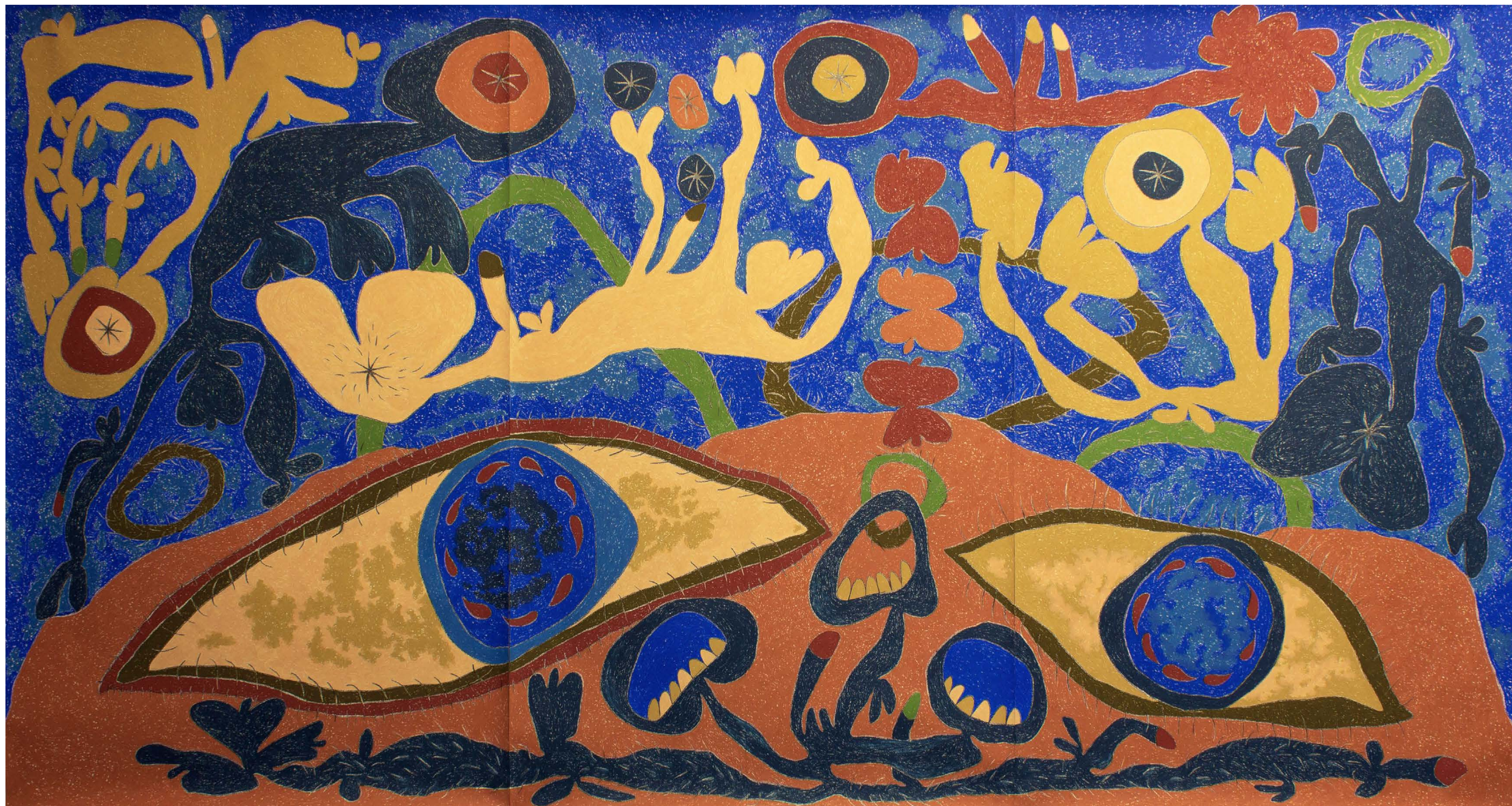
Watching the moon with Binoculars, 2019 Pastel al óleo y grafito sobre papel / Oil Pastel and Graphite on Paper 236 x 457 cm / 96 x 180"