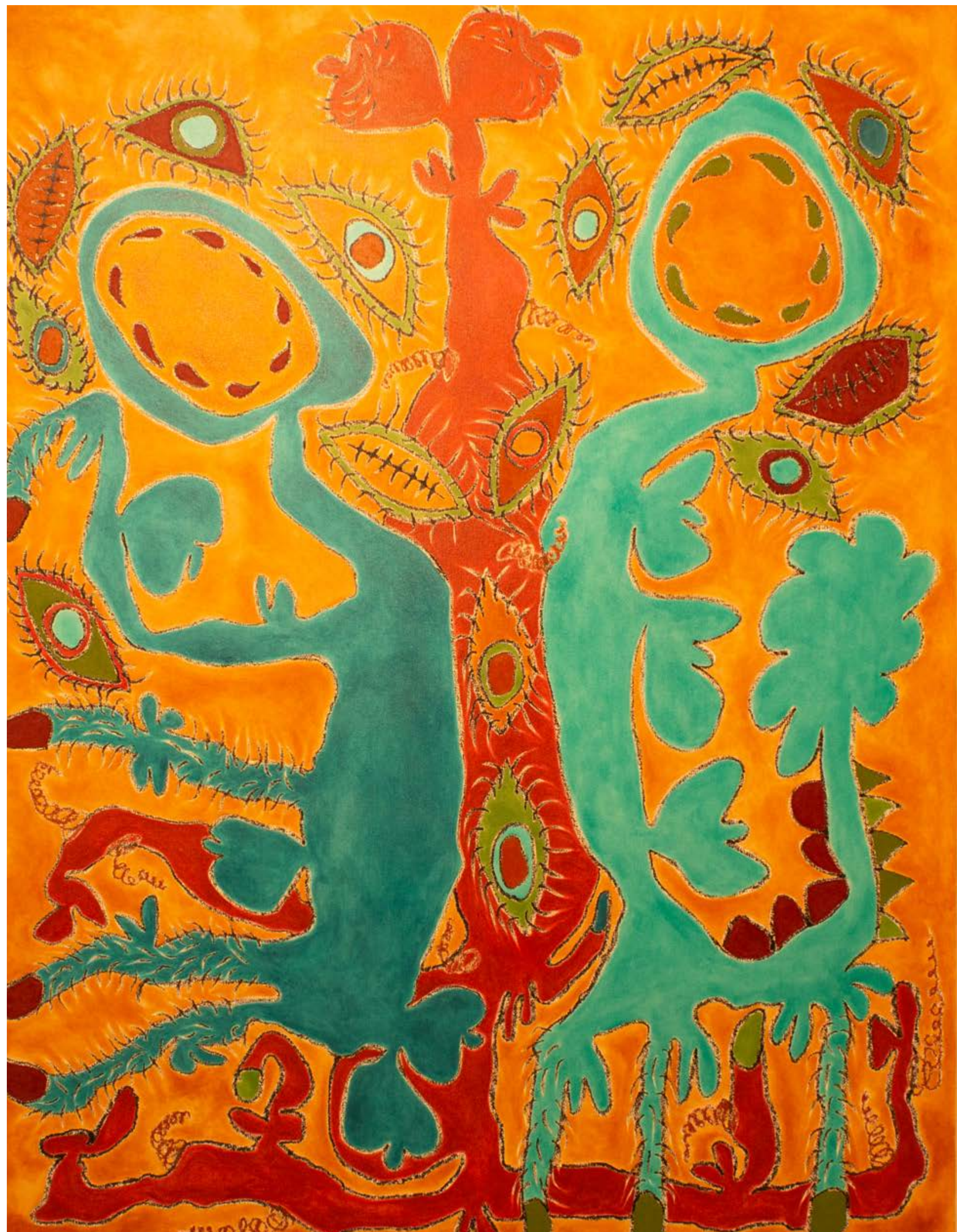
Meditation Session, 2019 Óleo sobre lienzo / Oil on canvas 213 x 162 cm / 84 x 64"