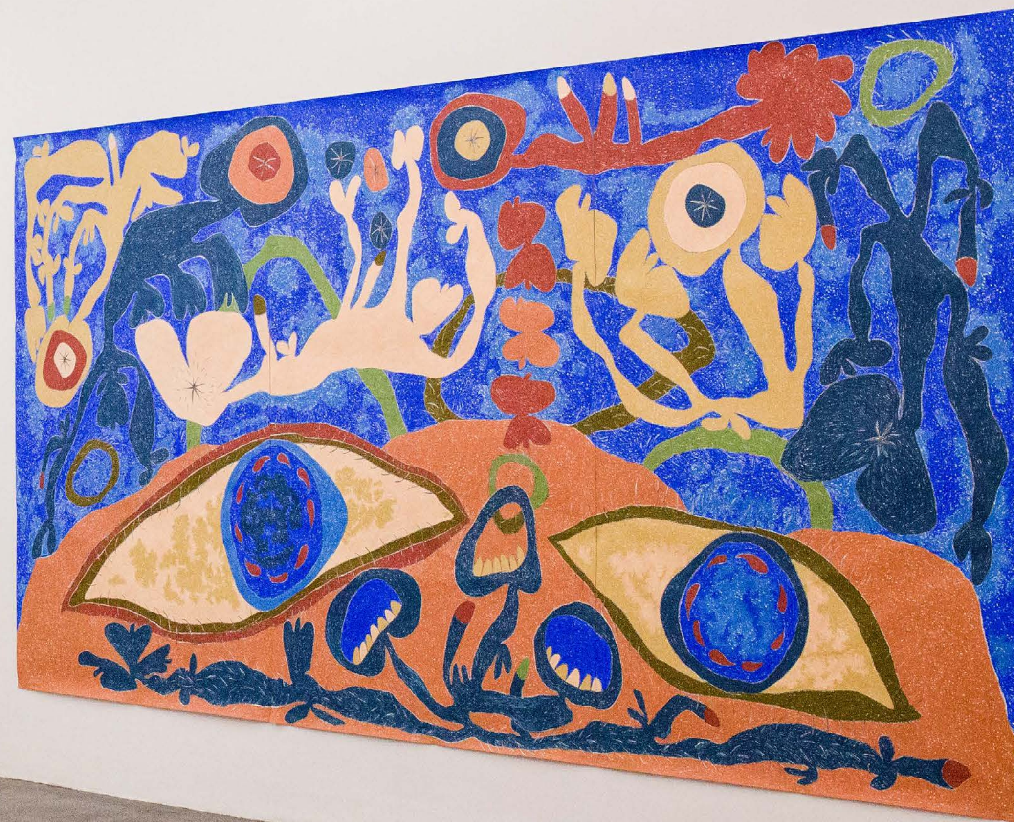
The Rotating Raffle Drum, 2019 Vista de la exposición Páramo, Guadalajara, México