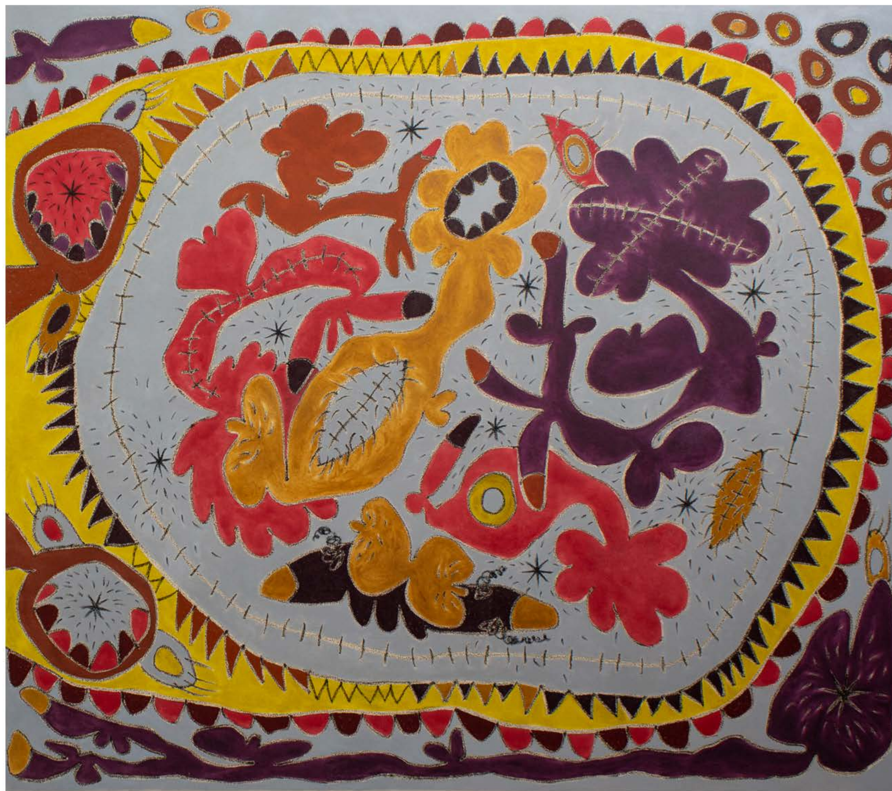
y / and Pastel al óleo, lápiz de color y grafito sobre papel / Oil Pastel, Color Pencil and Graphite on Paper 183 x 91 cm / 72 x 36"