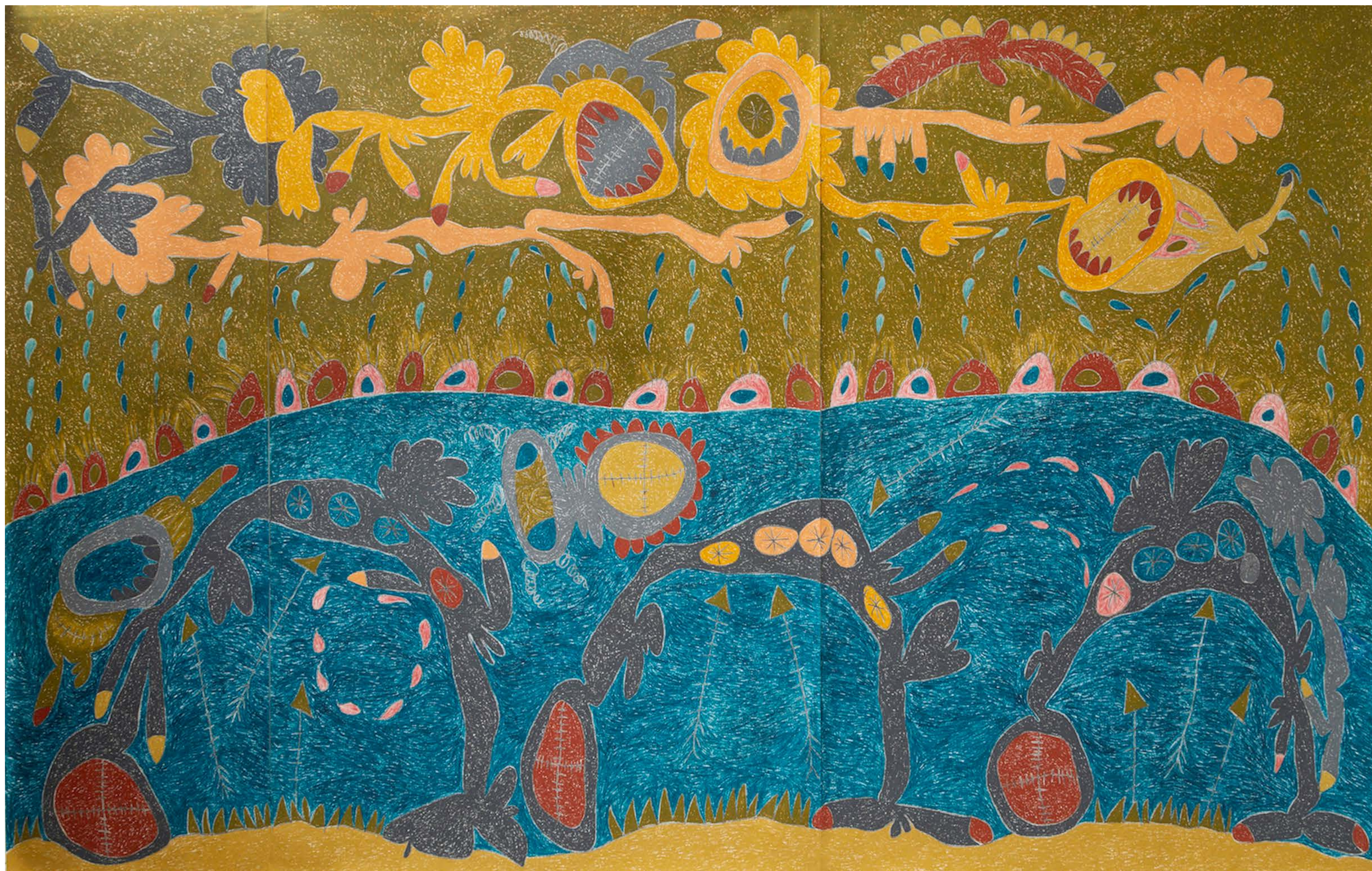
Left Behinds , 2019

Pastel al óleo, lápiz de color y grafito sobre papel / Oil Pastel, Color Pencil and Graphite on Paper