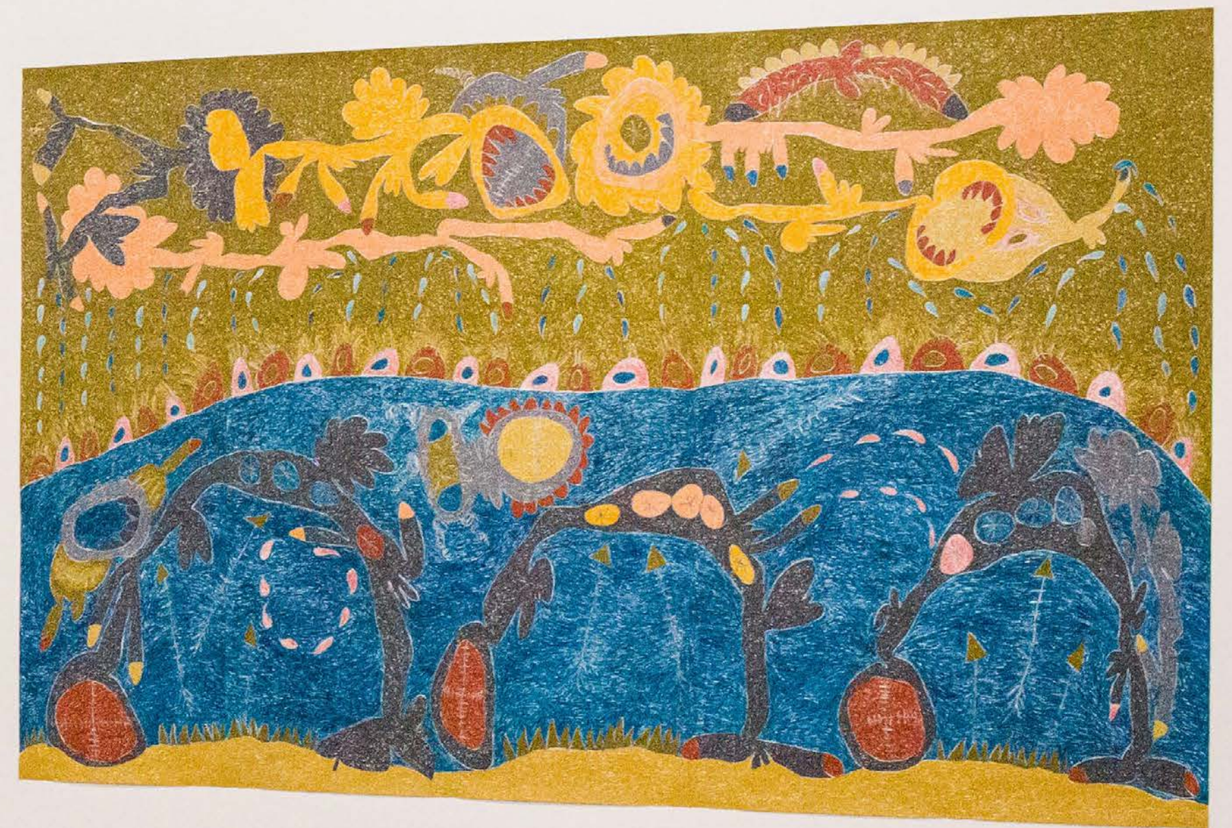
The Rotating Raffle Drum, 2019 Vista de la exposición Páramo, Guadalajara, México