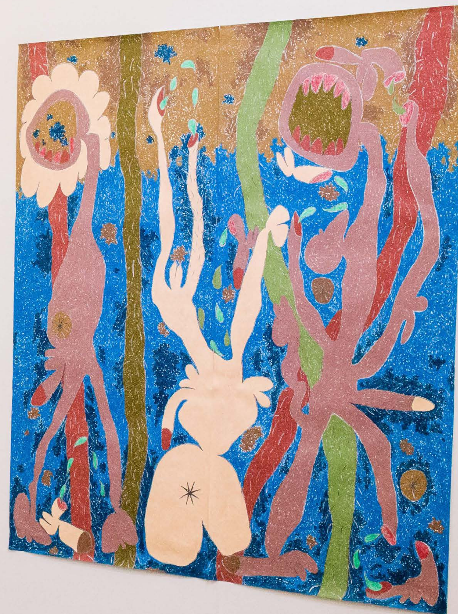
The Rotating Raffle Drum, 2019 Vista de la exposición Páramo, Guadalajara, México