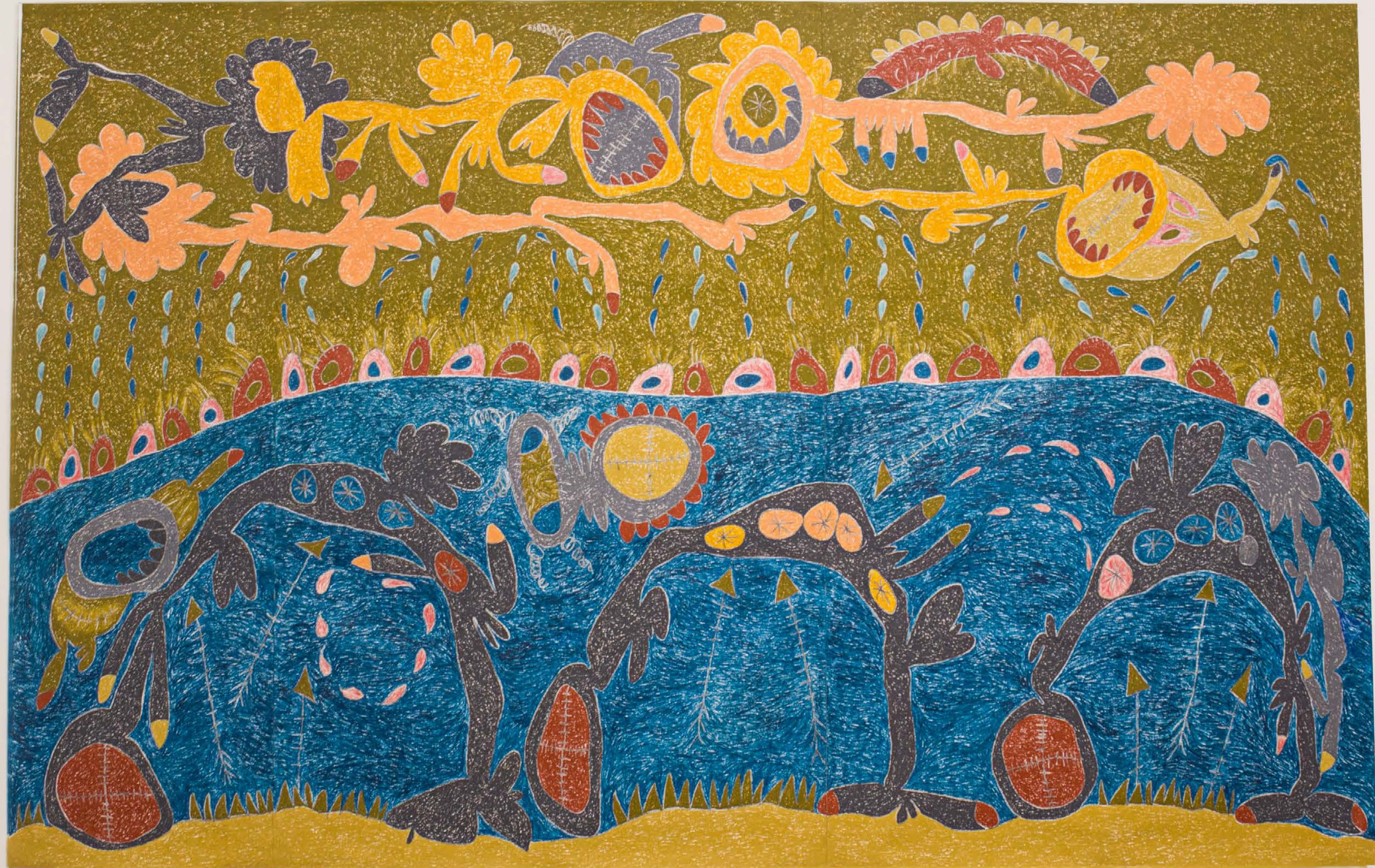
The Rotating Raffle Drum, 2019 Vista de la exposición Páramo, Guadalajara, México