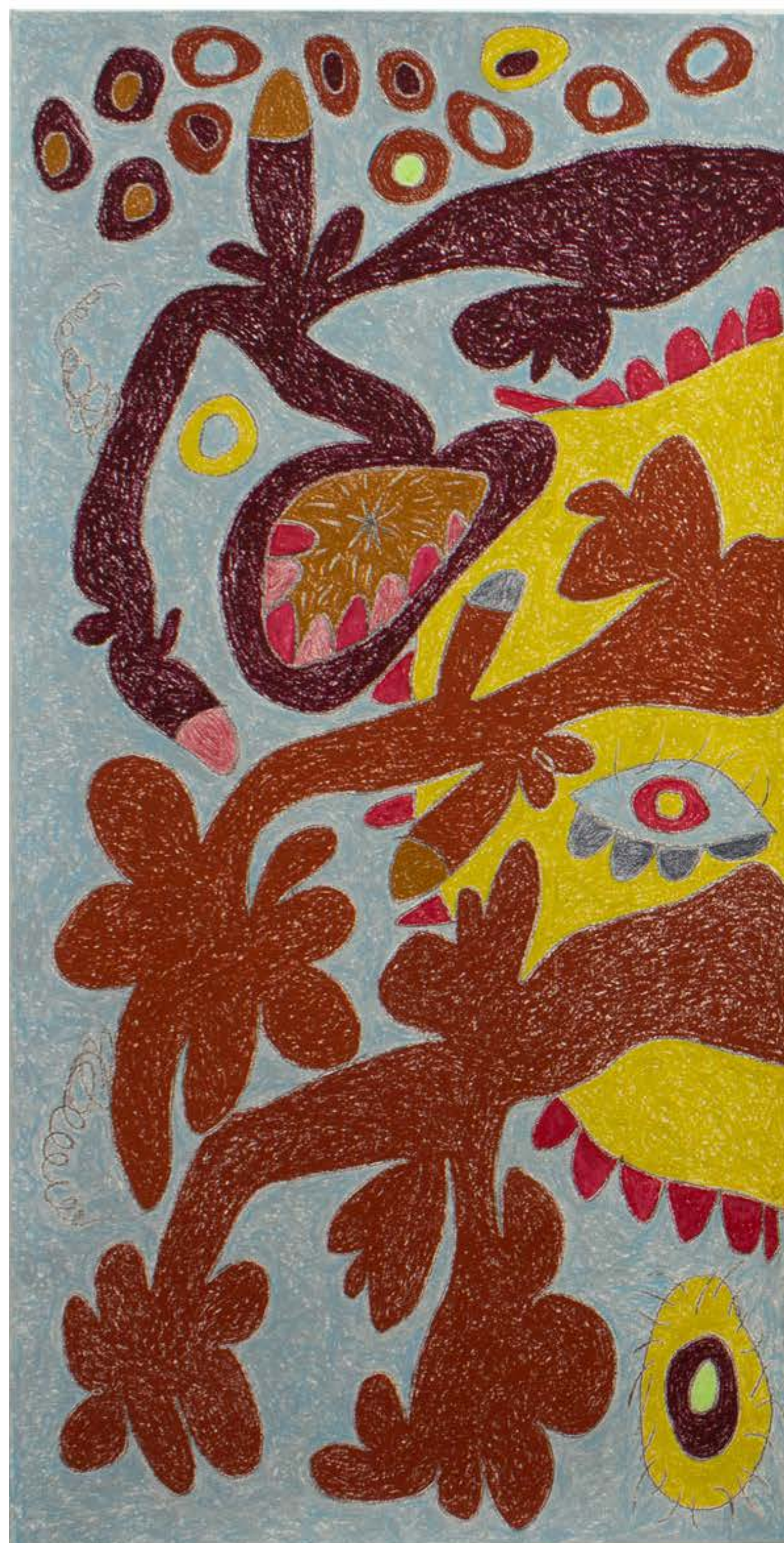
Inhale , 2019 Híbrido (Díptico) / Hybrid (Diptych) Óleo sobre lienzo / Oil on canvas 183 x 213 cm / 72 x 84"