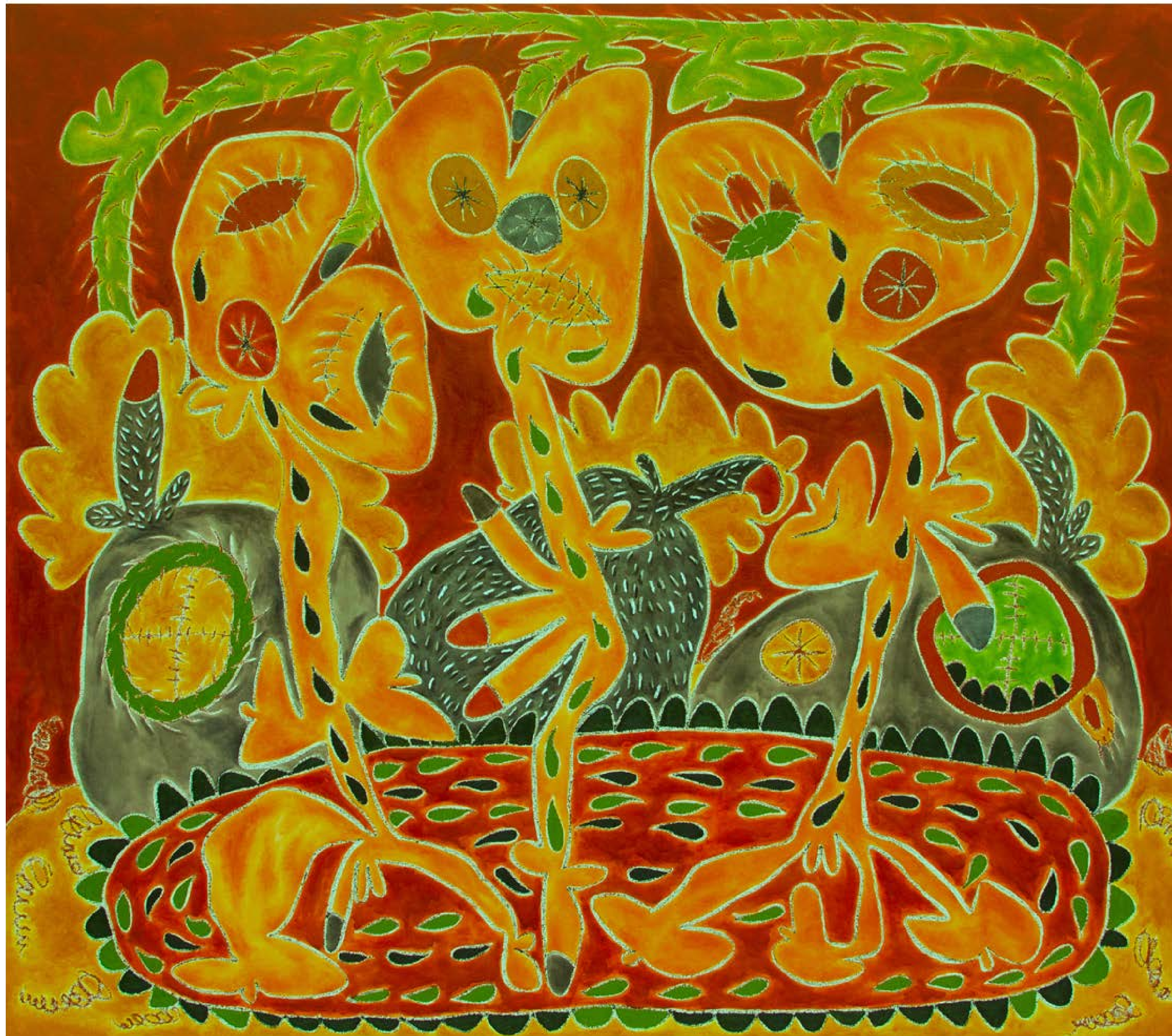
Water does not stop the burning, 2019 Óleo sobre lienzo / Oil on canvas 183 x 213 cm / 72 x 84"