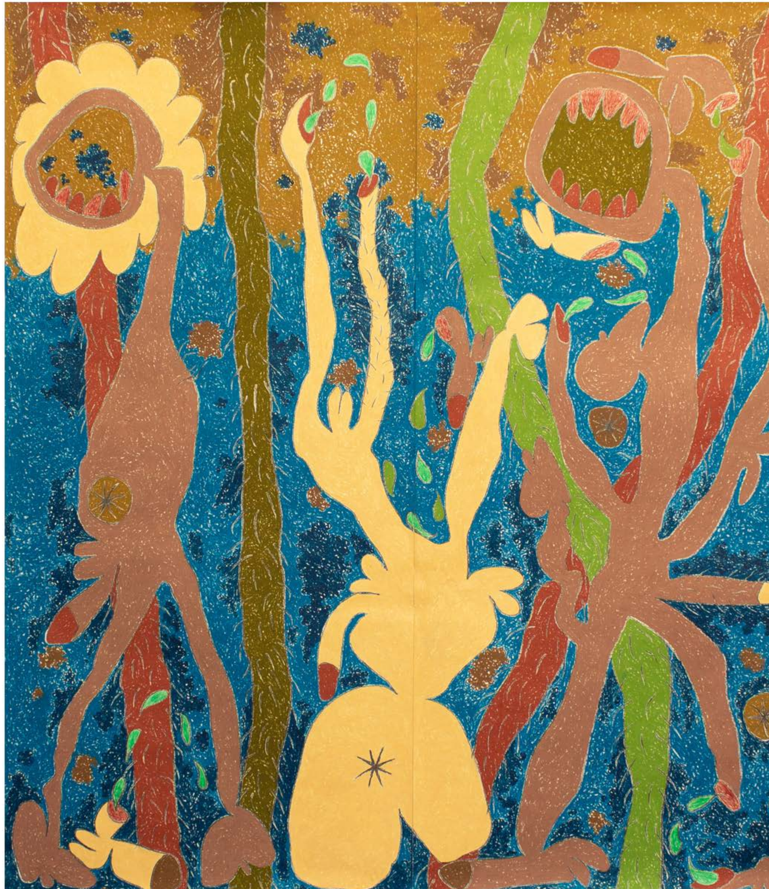
This ground is not stable , 2019 Pastel al óleo y grafito sobre papel / Oil Pastel and Graphite on Paper 236 x 457 cm / 96 x 180"