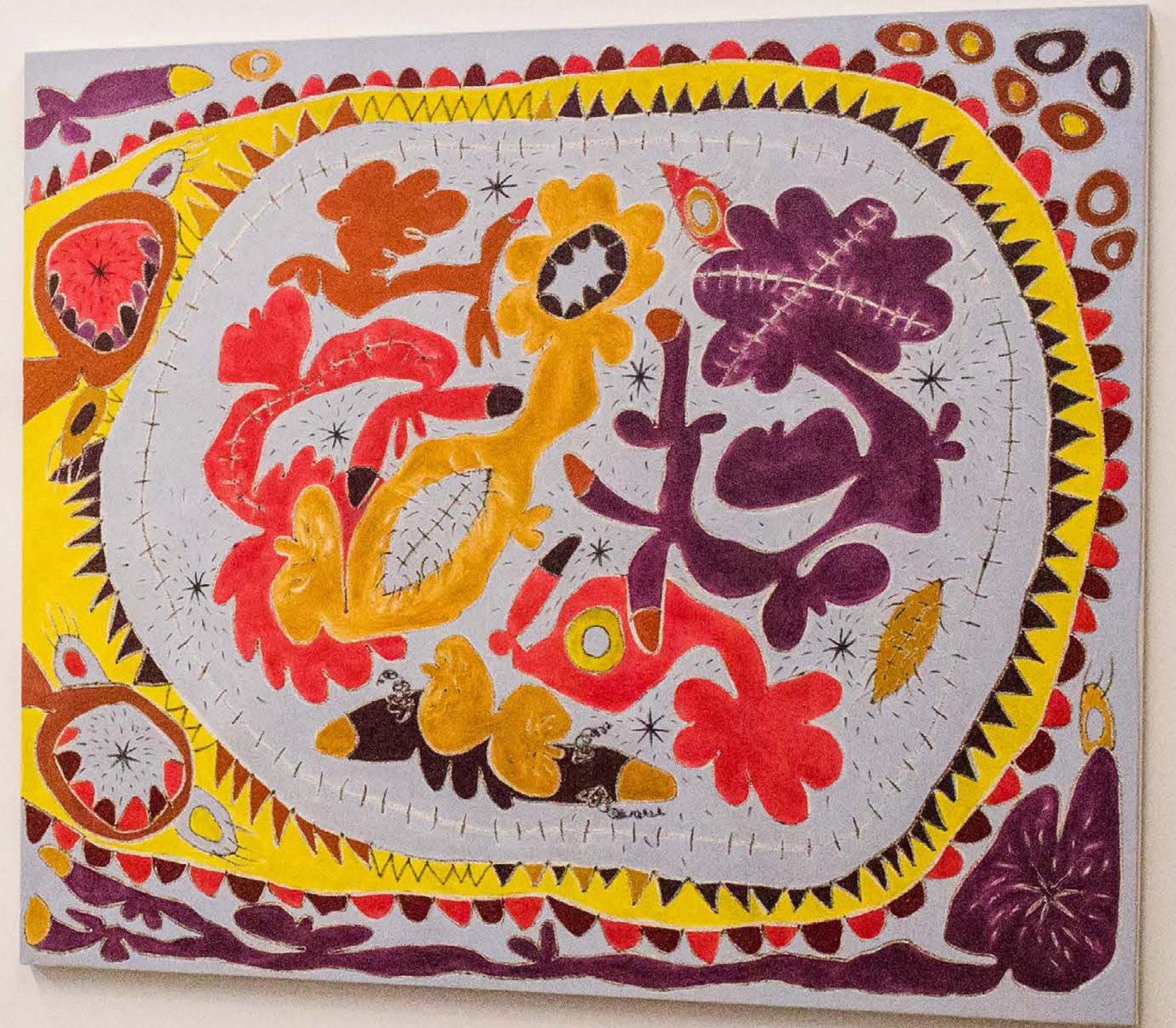
The Rotating Raffle Drum, 2019 Vista de la exposición Páramo, Guadalajara, México